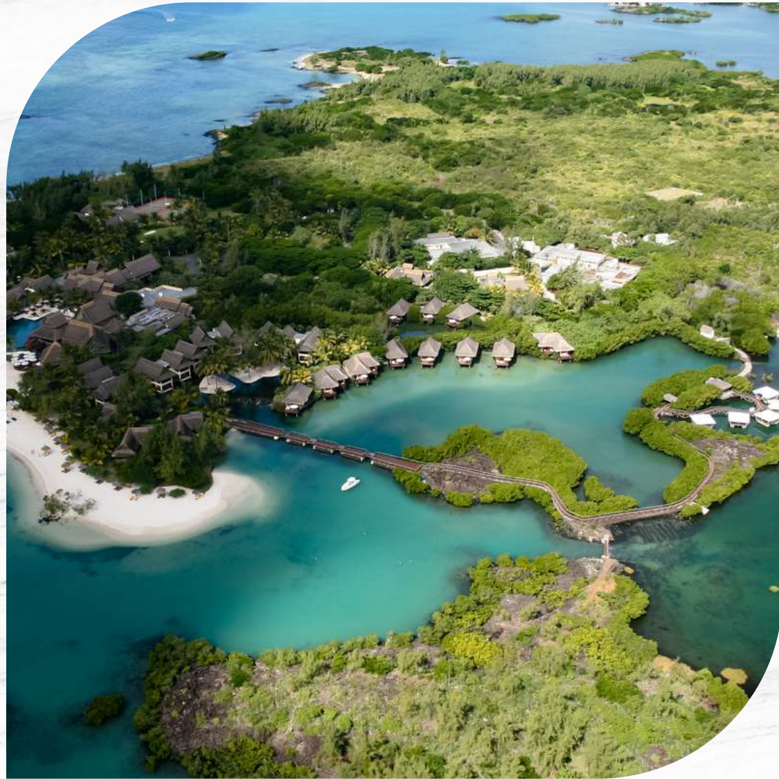
Isola dei Cervi