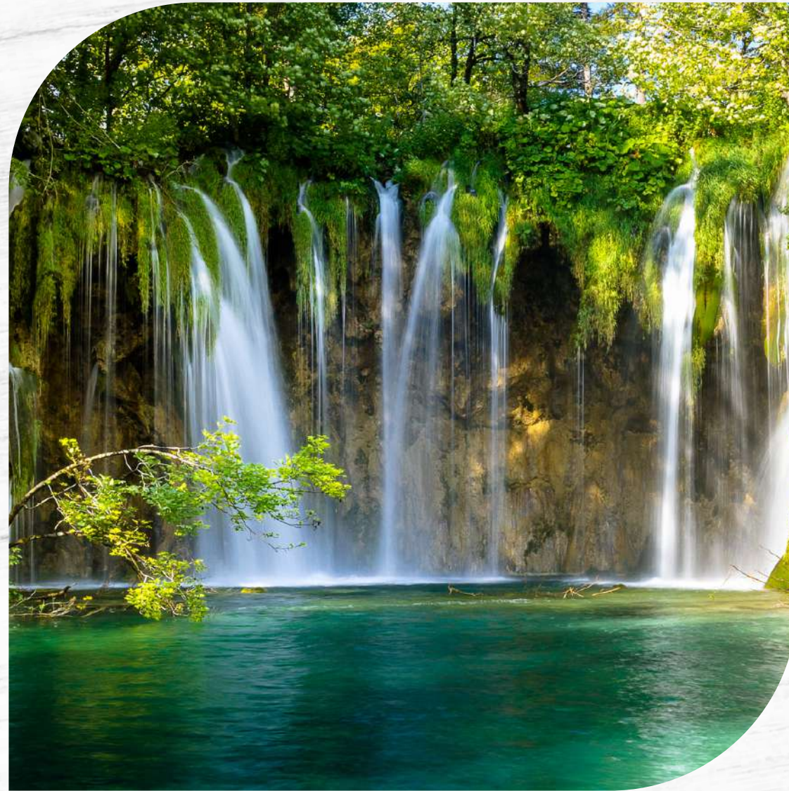
Parco nazionale delle gole del Fiume Nero