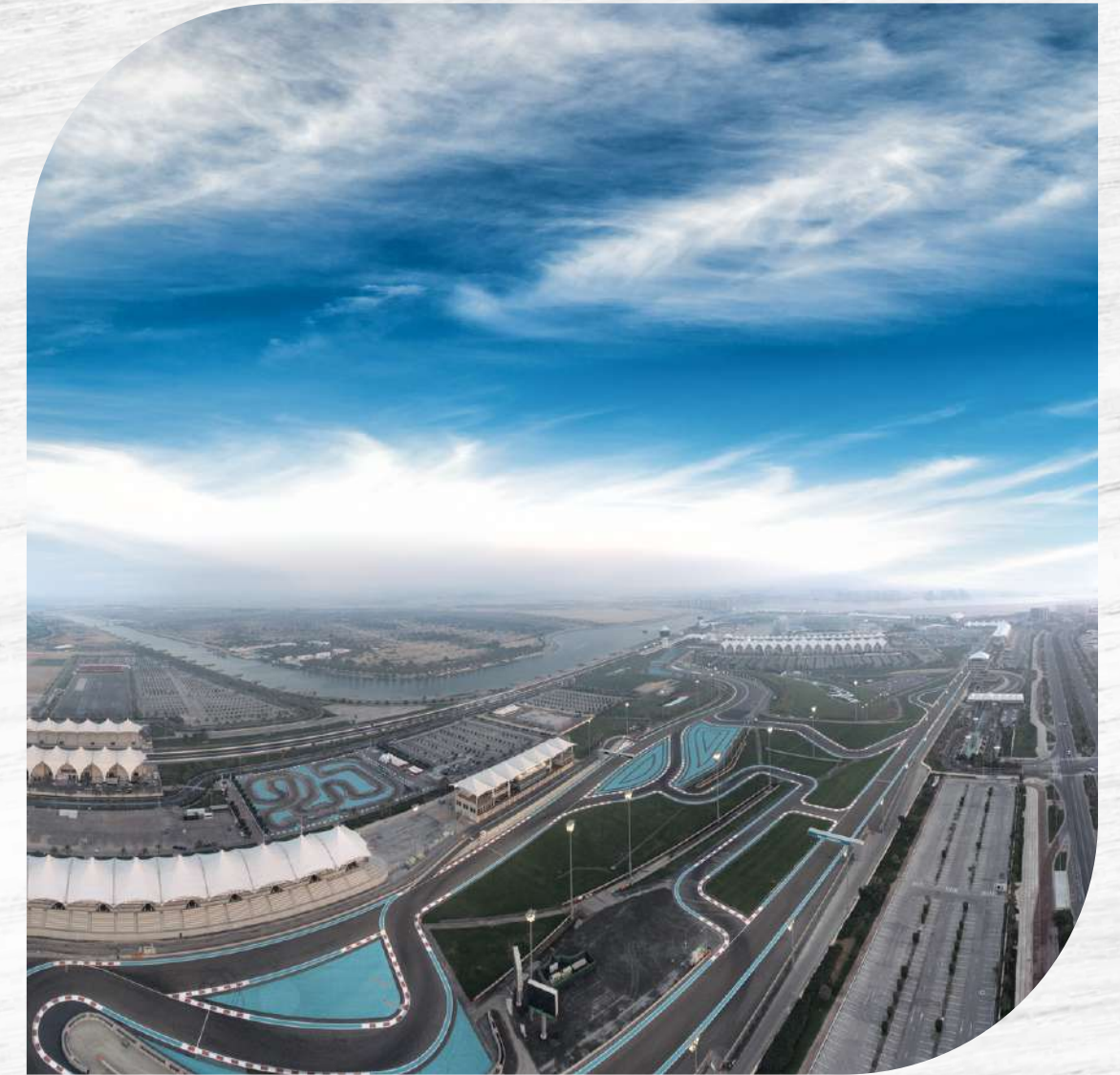
Yas Marina West Circuit