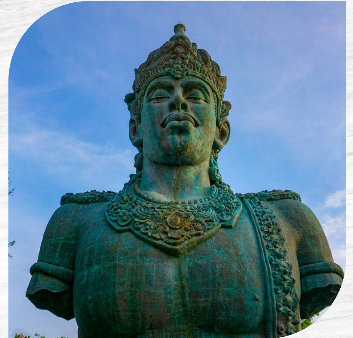
Garuda Wisnu Kencana