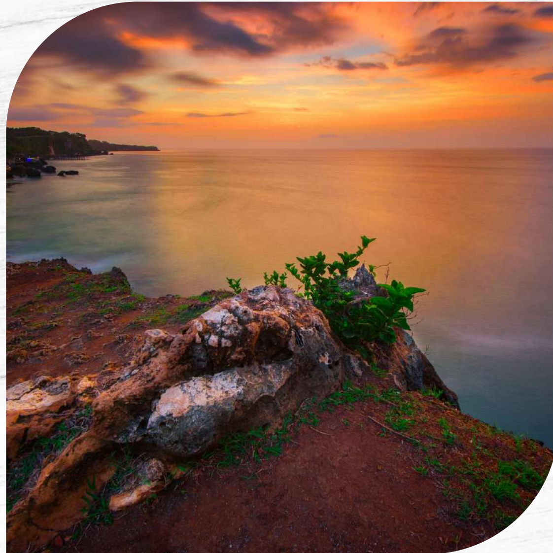
Tegal Wangi Beach