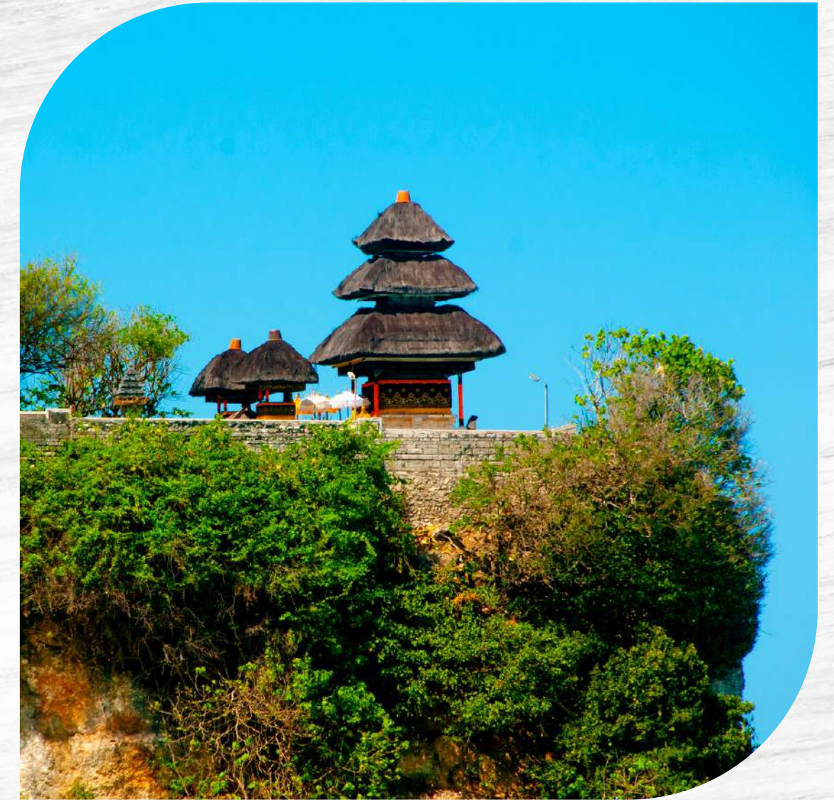
Tempio di Uluwatu