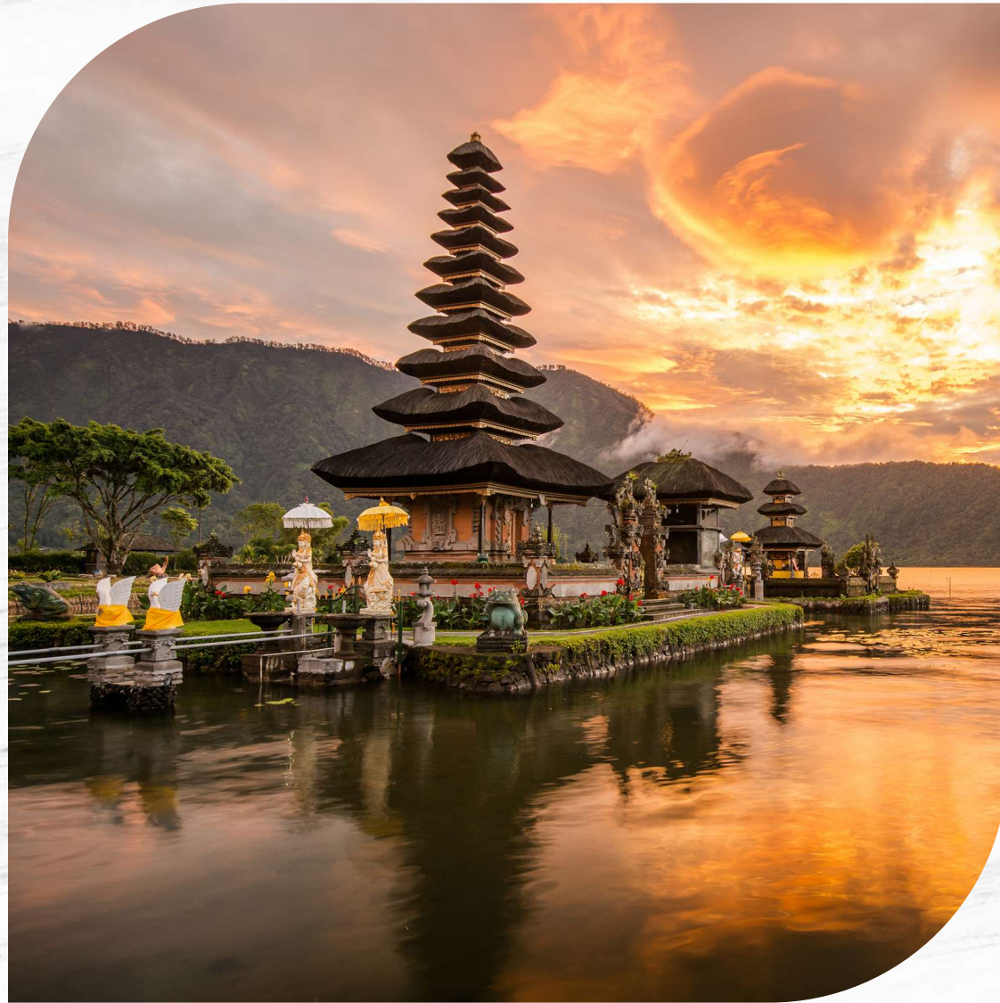
Pura Ulun Danu Bratan