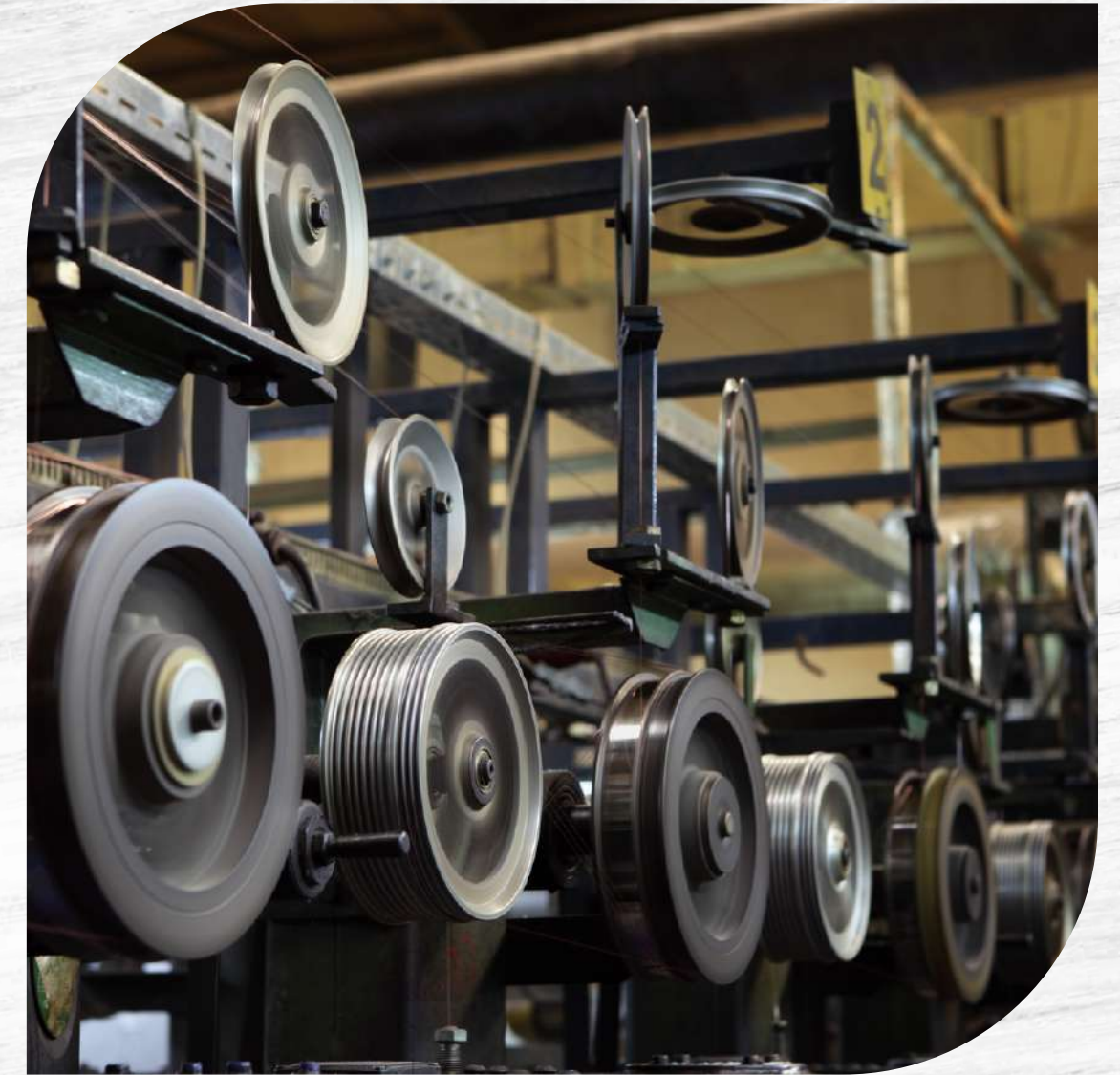
Oskar Schindler's Enamel Factory