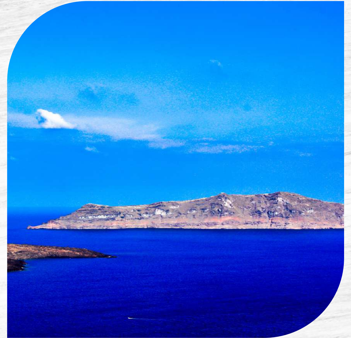
Caldera di Santorini