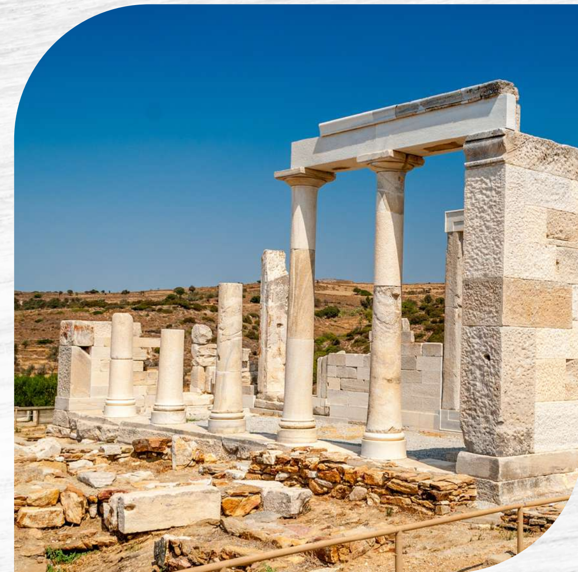
tempio di Demetra